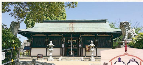
心願成就 柳澤神社 御殿だるま

時 夏季:7時~19時(4月~9月) 冬季:7時~17時(10月~3月) 料 無料