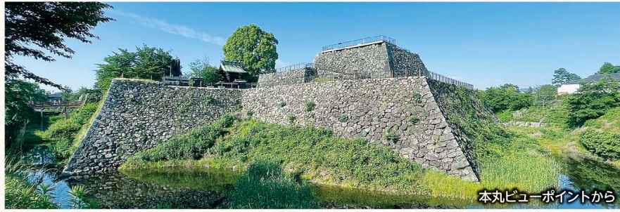
本丸ビューポイントから

郡山城は、地元の戦国大名筒井順慶の築城に始まり、天正13年(1585)9月、紀伊国、和泉国、大和国の領主として入部した豊臣秀長によって、荒々しい野面積み石垣を持つ大和国最大の城郭が作られました。(令和4年国史跡指定)