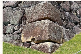
でんらじょうもんせき