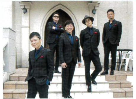
チキンガーリックステーキ (大和丸なすPR大使)