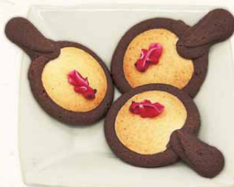
金魚すくいサブレ

営業時間: 10:00~17:00 カフェは11:00~16:00 定休日: 火曜・水曜 TEL: 0743-55-3889