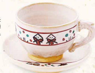
奈良絵コーヒーカップ&ソーサー

営業時間: 10:00~17:00 定休日: 不定休 TEL: 0743-52-3274