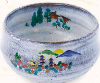
薬師寺東塔基壇土 薬師寺景茶盃

営業時間: 8:00~17:00 定休日: 不定休 TEL: 0743-52-3323