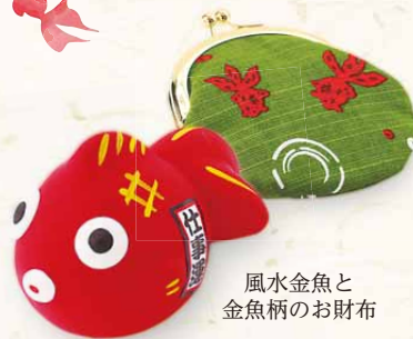
風水金魚と 金魚柄のお財布

営業時間: 9:00~18:00 定休日: 1/1~1/5 TEL: 0743-55-7770